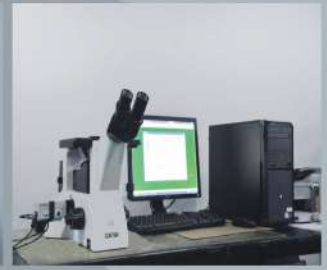
金相图像分析系统