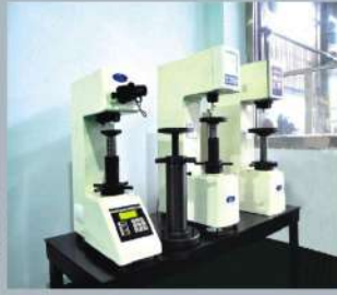
布氏、洛氏、维氏硬度检测仪