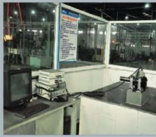
固有自振频率检测仪