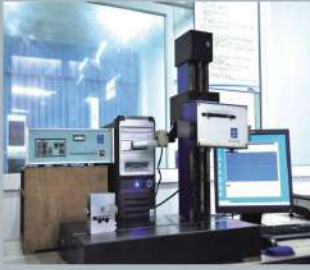
表面粗糙度测量仪