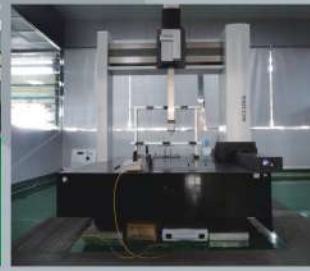
蔡司三坐标检测仪